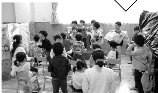
あかぐみさんや先生にお披露目！！

10月のアート展できい・しろぐみさんが作った大きなお家。それを今度は「映画館にしたい！」と盛り上がり、映画館に必要なもの作りが始まりました。だんだんとできると、お客さんを招待しようということになり、次はあかぐみさんや先生たちを呼ぶ計画のスタートです。その中でもしろぐみさんがリーダーシップを取り、「あかぐみさんがわかるお話を作ろう」「楽しい踊りやお歌も聴いてもらおうと喜んでもらえるよ」と話し合いを進め、映画館作りから様ざまなごっこ遊びへと展開していきました。それぞれが決めた役割に取り組み、実際にあかぐみさんやせんせいたちに映画上映やお歌や踊りの披露をしたときの子どもたちのいきいきとした表情は本当に輝いており、自分たちで考え、やり遂げたことを認めてもらった充実感でいっぱいのようなのでした。先日、グループ園や外部の園から園見学の方が来られた際にも、自分たちから「お客さんにも見てもらいたい！」と意欲満々で準備をし、お披露目していた子どもたちです。あかぐみさんでもアート展で作ったお家から「トトロの森が作りたい！」と盛り上がり、たくさんの自然物を使ったあそびや、しろぐみやきいぐみさんで見たあそびを真似て遊んだりしながら、どんどん素敵なあそびが広がっています。どのクラスでもしっかり子どものつぶやきを受け止め、子どもたちの発想からどんどんあそびをつなげ発展していけるよう、保育者も日々アンテナを張り巡らせ、子どもたちのつぶやきを聞き逃さぬようにしています。今後もあそびの連続性を常に意識し、子どもたちを真ん中において保育を進めていきます。1月に予定している幼稚園で初めての生活発表会。「こんどはお父さんお母さんたちにもみてもらおう！」と張り切っており、今、話し合いを進めている子どもたちです。どのような発表会になるか私たちも子どもたちと一緒に楽しみながら取り組んでいきたいと思ひます。