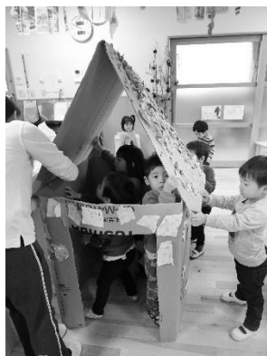
あかぐみさんでも、新しい お家作りです。