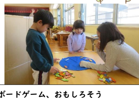
ボードゲーム、おもしろそう きょうだいで親でもないけれど、「おもしろそう」という共通の気持ちで集まっています