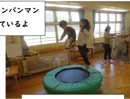
小学生のジャンプは高いよ