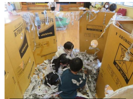
新聞ハウスの中はこんな感じ