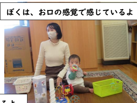
ぼくは、お口の感覚で感じているよ