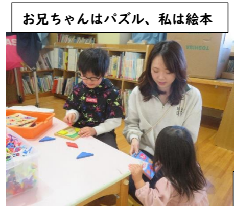
お兄ちゃんはパズル、私は絵本