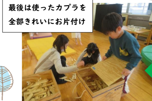
最後は使ったカプラを 全部きれいにお片付け