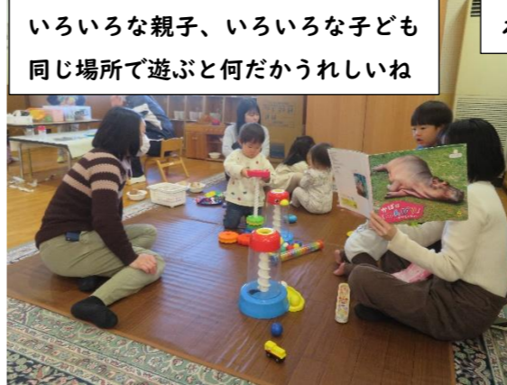
いろいろな親子、いろいろな子ども 同じ場所で遊ぶと何だかうれしいね