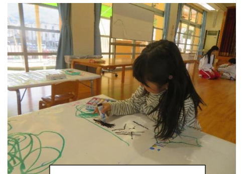
小学校のお勉強みたい