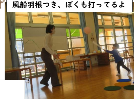
風船羽根つき、ぼくも打ってるよ