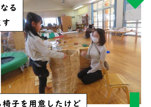
中に入りたから椅子を用意したけど やっぱりママに抱っこしてもらおう