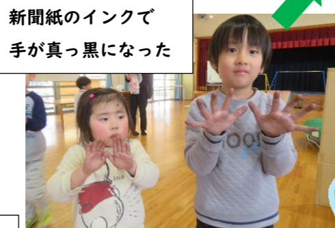
新聞紙のインクで 手が真っ黒になった