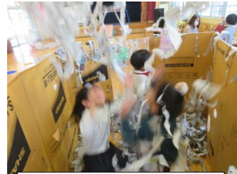
新聞紙いっぱい、おもしろい