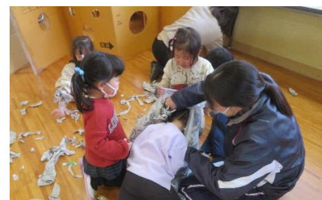
新聞紙を集めるよ、顔を使って押し込んでるよ