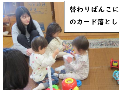
替わりばんこにアンパンマン のカード落とししているよ