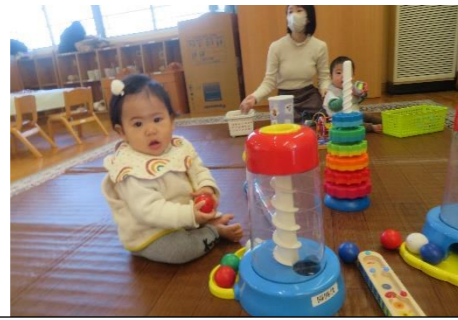
あっちもこっちもいろいろ見て感じているよ