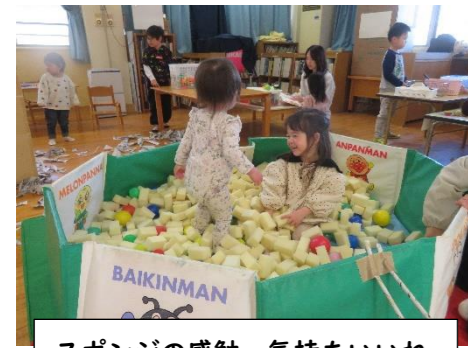
スポンジの感触、気持ちいいね