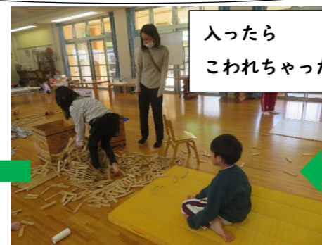
入ったら こわれちゃった