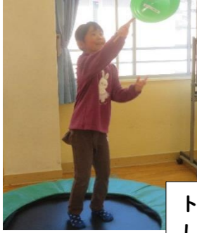
トランポリンで跳びながらの血回しなどなど 小学生のあそび方はおもしろい!