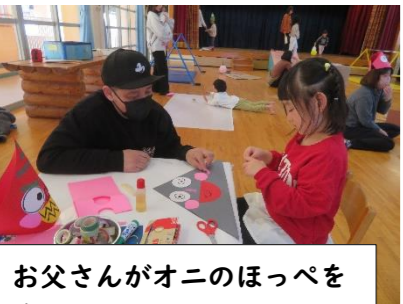
お父さんがオニのほっぺを作っていました