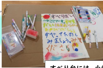
すべり台には、小学生たちがすてきな看板を作ってくれています