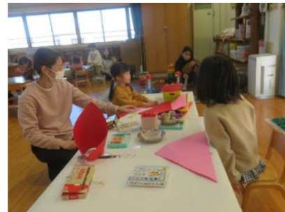
オニのお面も作ってみました 自分で作ると、かぶりたくなるね