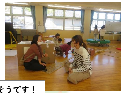
お父さん、お母さんといっしょに遊ぶのも楽しいね。お父さん、お母さんたちの楽しそうな会話が聞こえてきそうです!