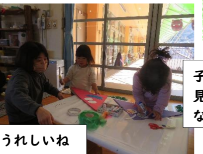
子どもはもちろん、大人のアイデアも見られ、こわ~いオニやかわいいオニなどどれも個性的でした