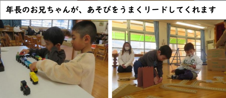
年長のお兄ちゃんが、あそびをうまくリードしてくれます