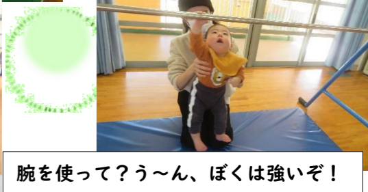
腕を使って?う~ん、ぼくは強いぞ!