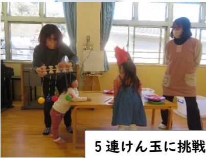
5連けん玉に挑戦! 大人も子どももがんばれ!