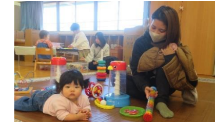
知っている人と、知らない人を区別しています