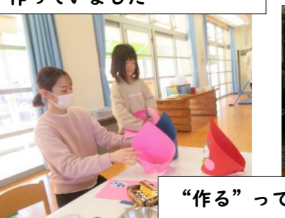
“作る”ってうれしいね