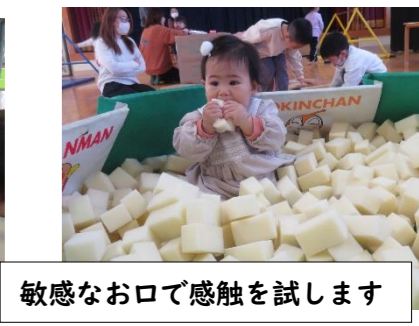
敏感なお口で感触を試みます