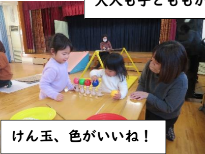
けん玉、色がいいね!