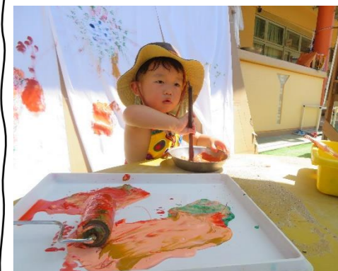
なが〜い筆をぐ〜んとのはしてペタペタ

暑い日でしたが、大人の方たちが、楽しく過ごされたり温かく見守って下さるおかげで、子どもたちも、やりたいあそびにトライしていましたね。いつもご協力、ありがとうございます。外で過ごす時間に考慮し、早めにシャワーと着替えをして、涼しい部屋で休んでいただきました。