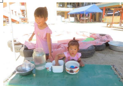
ごっこあそびプールのお魚で、ごっこあそび