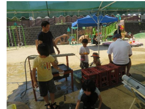
ママと一緒にあそぶのもおもしろい