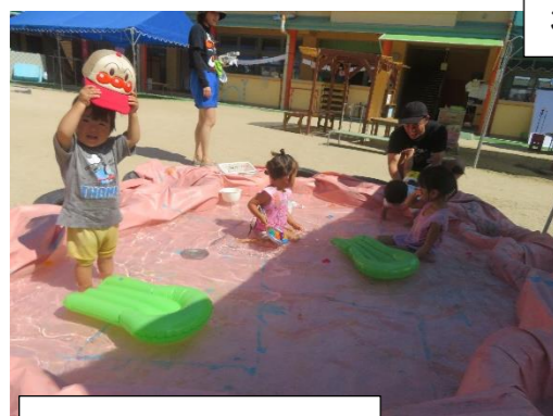
水の中は気持ちいいね

暑い暑い日だったこともあり、やはり『水』の感触は格別なようで保育園や子どもも小学生も大人も、手を濡らし足を濡らし、そして身体を使って『水』の中へ! 『水』流れの速さや落ち方、身体の動かし方によって、どうにでも変化する『水』はおもしろい素材であり、お友だちですね。