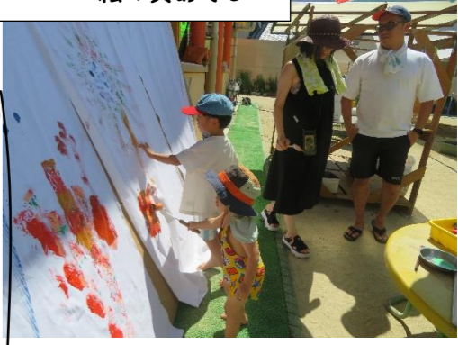
布にペタペタコロコロ絵の具あそび