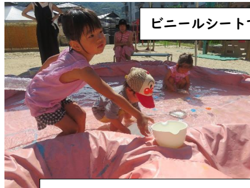
ビニールシートでプール