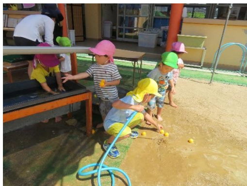
小学生のあそびもおもしろい