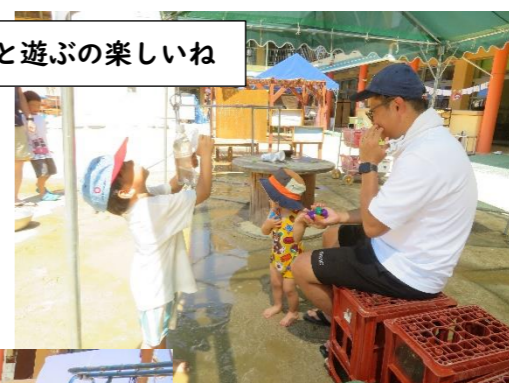
お父さんと遊ぶの楽しいね

お父さんの参加も大歓迎です。そこにいるだけで、子どもは安心して遊ぶことができますね。「見て見て、おとうさん!」「お父さん、こっちに来て!」お父さんのこと、大好きなんですね