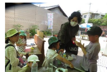
わたしもお兄ちゃんといっしょのことができるよ。見ててね。