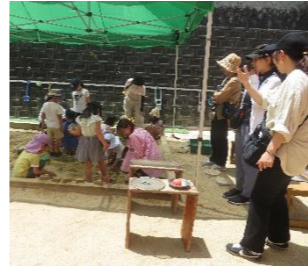
お砂場は、毎回たくさん子どもと大人でにぎわっています