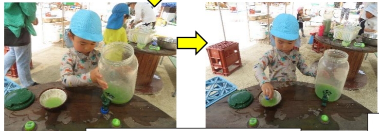
こうして入れればいいんだよ