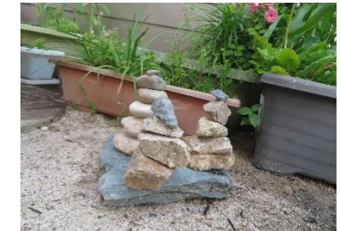
こんなフシギなアートも！