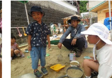
クラスのお友だちとサラ粉作り