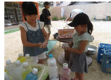
手がヌルヌル「納豆みたい」「お姉ちゃんもやってみて！」