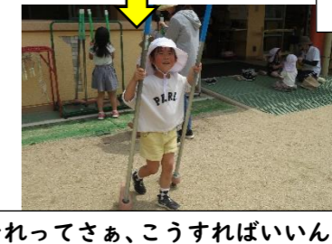
「それってさあ、こうすればいいよ」