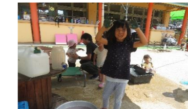
こんな色の手も洗っちゃえ〜