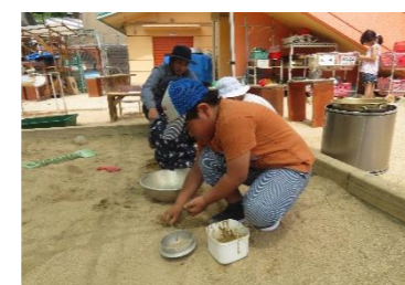
「ぼくは、これがしたかったんだよ。」