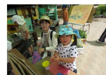
ねんどムニムニ気持ちいいね