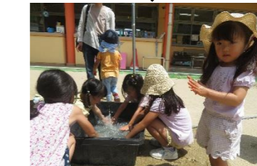
みんなで洗うと楽しいね