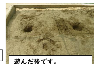
遊んだ後です。砂場に何かいるみたい。