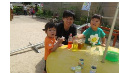
お父さんといっしょなら、何でも楽しいね