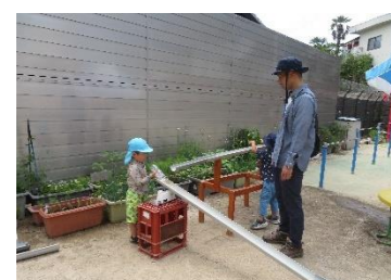
「ボールが転がってきたら、ぼくが水を流すよ」

といの長さ、傾きといの重なり加減など考えたり工夫したりできるあそびに、水の流れも加えられ、学びの多いあそびの1つでしたね