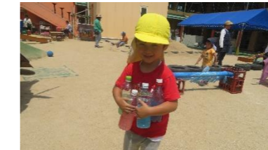
ぼくは、こんなに持っているよ。色もいろいろあるし、力持ち！