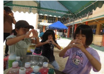
「みてみて、シャボン玉ができる！」