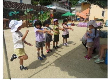
「高木先生、曲かけて。運動会で、こんなリズムをしたんだよ。かっこいいでしょう。」