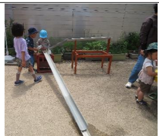
「今度は、ぼくが水を流すよ」

同じ保育園のお友だちではなくても、同じあそびでつながり、笑い合い、協力し合っている姿は、大人が忘れてしまっていることなのかも？