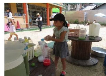
「もうちょっと、せっけんをつけてみよう。おもしろいよ。」