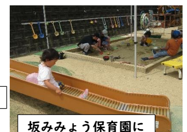
坂みみょう保育園に久しぶりに来たよ