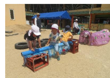
いろんな飛び越し方があるね