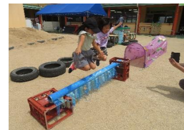
手をつないで大ジャンプ！