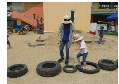
おとっと、タイヤ歩きにも挑戦！