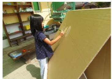
これ、絵の具じゃないよ。何の色だと思う？