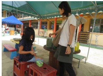
固形せっけんをスリスリ削り