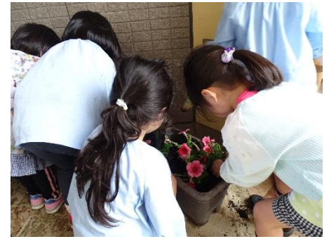
「同じお花を集めてもきれいだね」