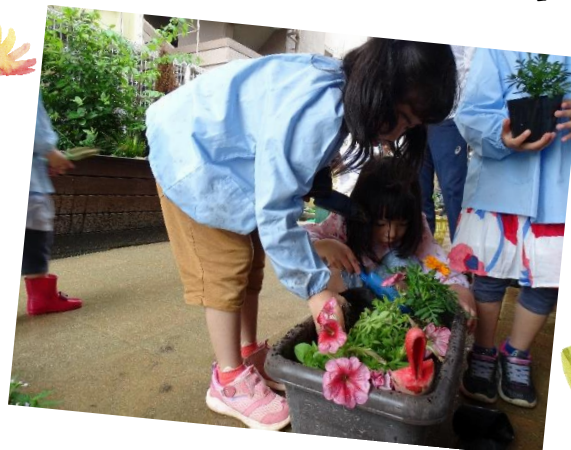
「ここにもお花を植えよう!!」