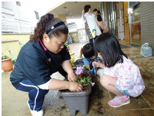
「根っこがでてくるから土をかけるんだあ」

自分たちの植え替えたお花を見て、「うん!かわいいね」と自信に満ち溢れていた表情をしていた子どもたちでした。