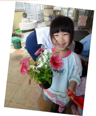
「きれいなお花だね!!」