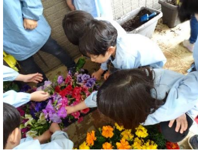
「いろいろな色があって素敵だね！」