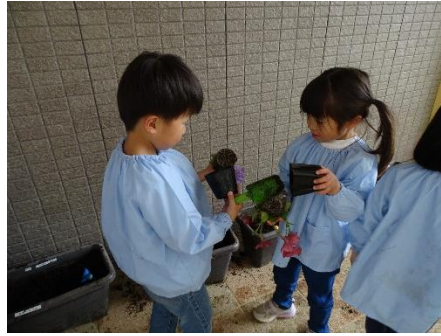
「こうやって植え替えるんだよね」