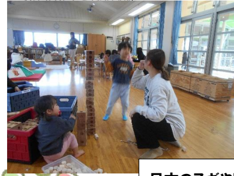
日本のスギヤヒノキで作られた“ズレンガ”