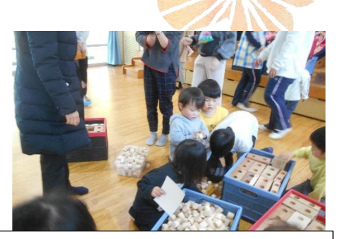
小さいお友だちも真似をしてお片付け