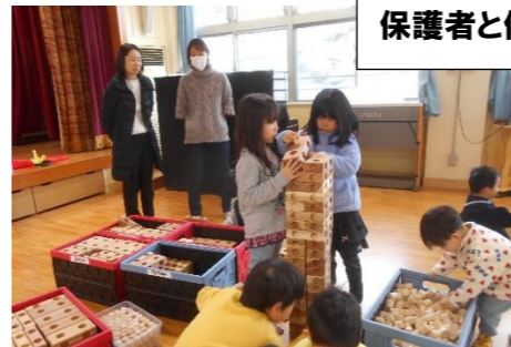
保護者と保護者で