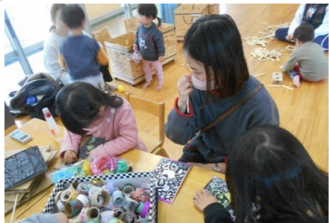
作品の持ち帰りを作ります