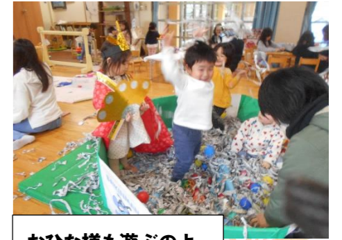
おひな様も遊ぶのよ