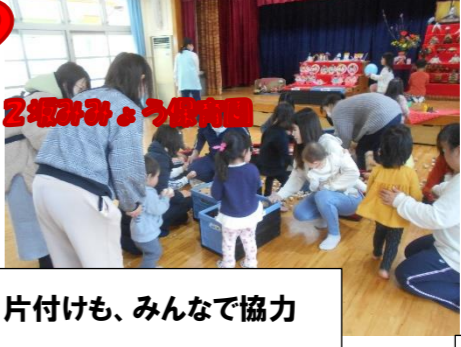
片付けも、みんなで協力