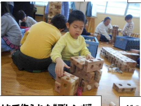
どのようなものが作りたいという目的をもったあそびになってきました