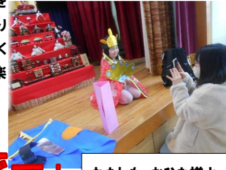
わたしも、おひな様よ

小学生の参加があり、同じ玩具でも、遊び方や組み合わせ方、作るものが違い、おもしろいと感じました。楽しいことへの集中力や表現力も「さすが！」と思わされます。