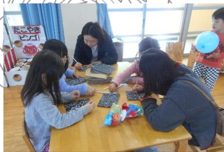
ひたすら、引っかいて色を出す