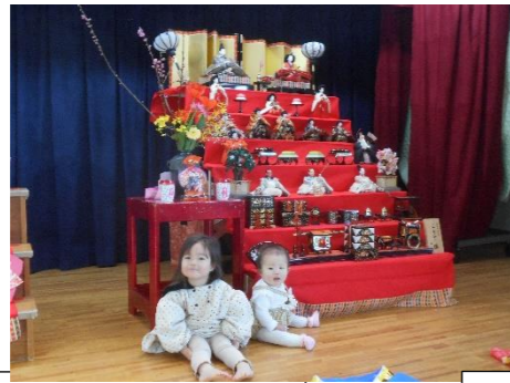
ひな人形になって、ハイチーズ！