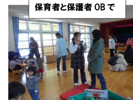
保育者と保護者 OB で

子どもと子ども、家族、保護者と保護者、保護者と保育者、保護者 OB と保育者などなど、いろいろな人と人のかかわりが、あちらこちらで見られました。普段とは違い、少しリラックスした空間でお話ができるのも、どようあそぼうでーのメリットだと思っています