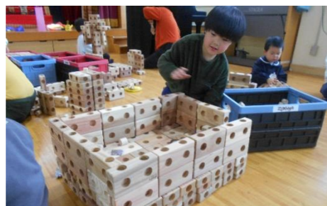
しゃべらず、もくもくと作る