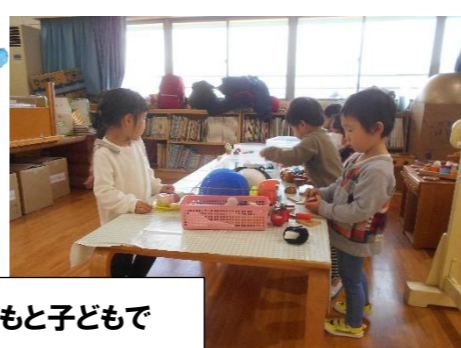
子どもと子どもで

スクラッチアートを楽しみました。先のとがったペンで、細かい絵を引っかいていく根気のいるあそびでもありました。