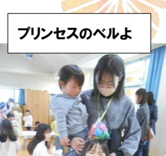
プリンセスのベルよ