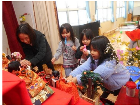
ひな人形を見たり、一緒に写真撮影