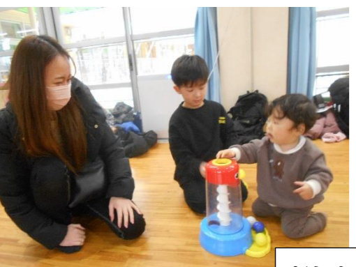
新年度入園のお友だちも参加してくれました