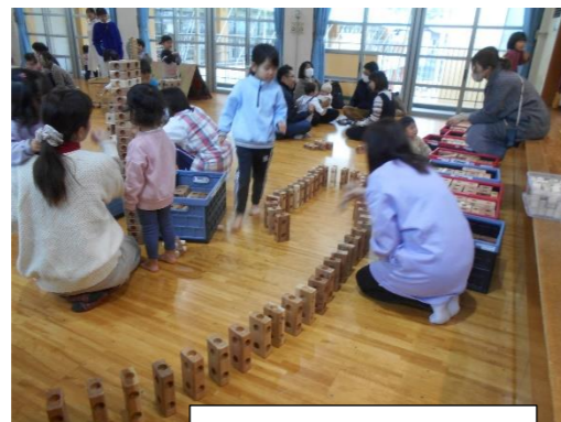
ドミノみたいに並べて