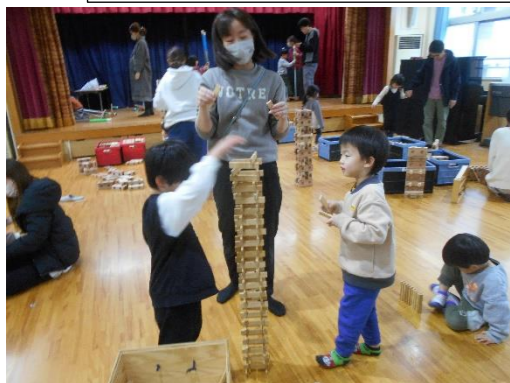
どこまで高く積めるかな？おとっと