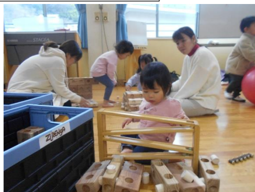
私は、こっちの方が好き