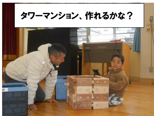
タワーマンション、作れるかな？