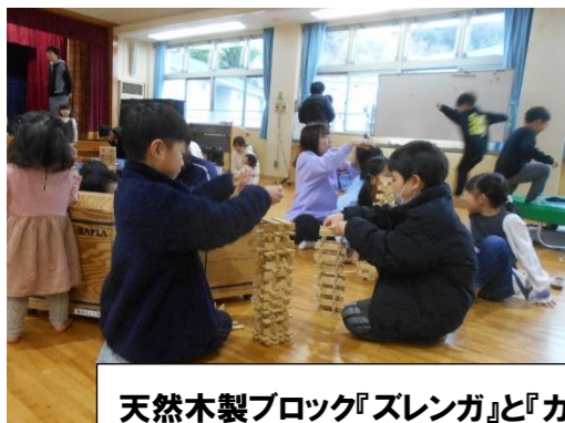
天然木製ブロック『ズレンガ』と『カブラ』を使って遊びました