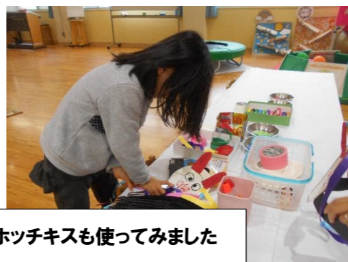
ホッチキスも使ってみました