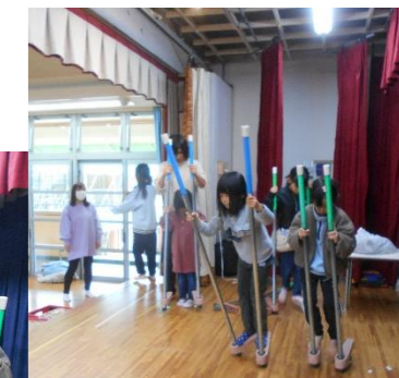
お友だちと竹馬に挑戦