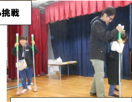
お母さんと、お父さんと挑戦

2月は、ホールが狭く感じられる程、ほんとうにたくさんの参加がありました。27 家族、総勢 60 人弱の参加がありました。大人も子どもも遊びたいもので楽しんだり、初めて保育園に来られ、保育園の雰囲気を感じて頂いたりしたようです。