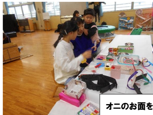
オニのお面を作りました