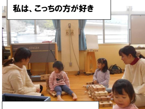
イスやすべり台みたいね