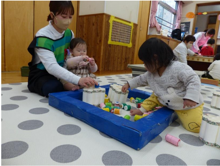
一人ひとりの興味や関心に合わせて じっくり遊べる環境