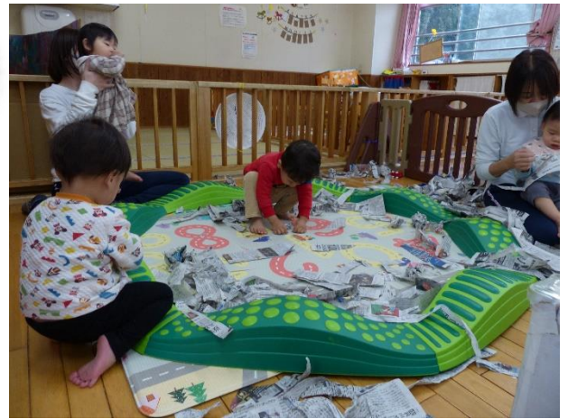
指先を使い破ったり、ビリビリの破れる音を楽しんだり…